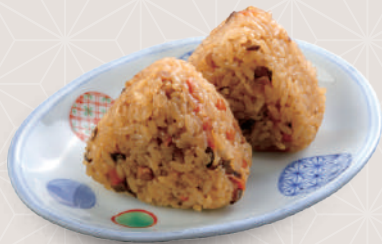
かしわおにぎり2個 300 税込 円