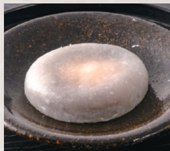
チーズクリーム大福 180 税込 円