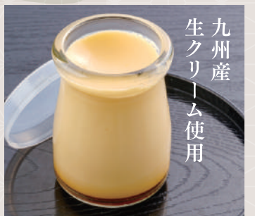
やっちゃんプリン 350 税込 円