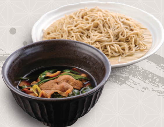
鴨せいりそば 1,080円 税込