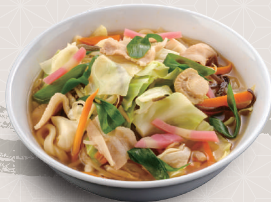
半兵衛さん 780円 税込