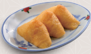
いなり3個 300 税込 円