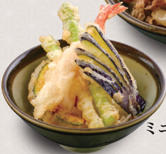
ミニ天丼 580 税込 円