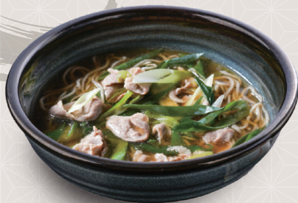
鴨南蛮そば 880円 税込