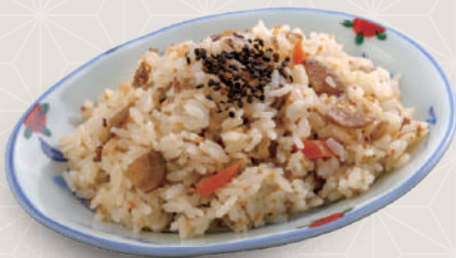
まぜめし 300 税込 円