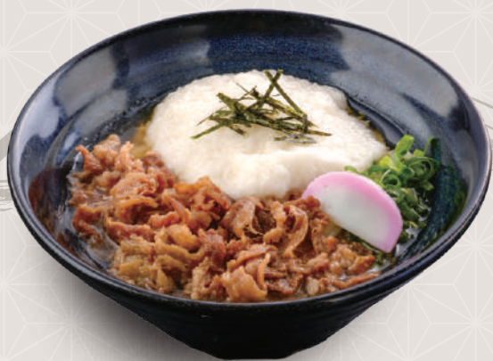
肉山かけうどん 1,050円 税込