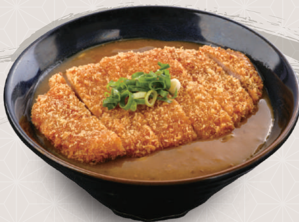
カツカレーうどん 1,080円 税込