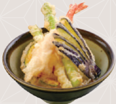
ミニ天丼セット 480円 税込