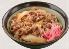
生卵 +90円 牛めしセット 480円 税込