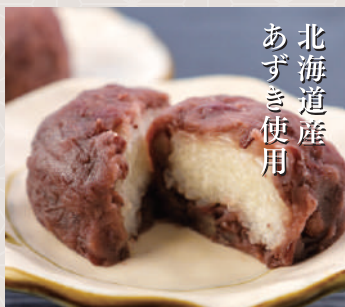
ぼたもち1個 180 税込 円