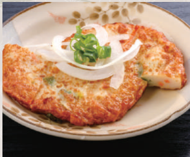
野菜のさつま揚げ 350 税込 円