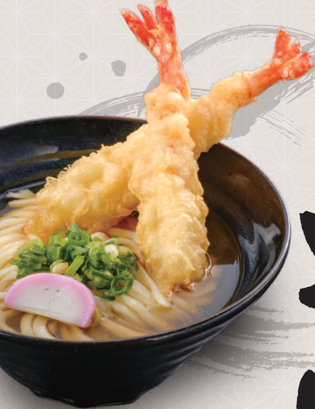
えび天うどん 850円 税込