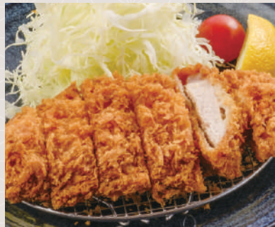
ロースカツ 980 税込 円