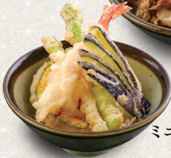
ミニ天丼 530 税込 円