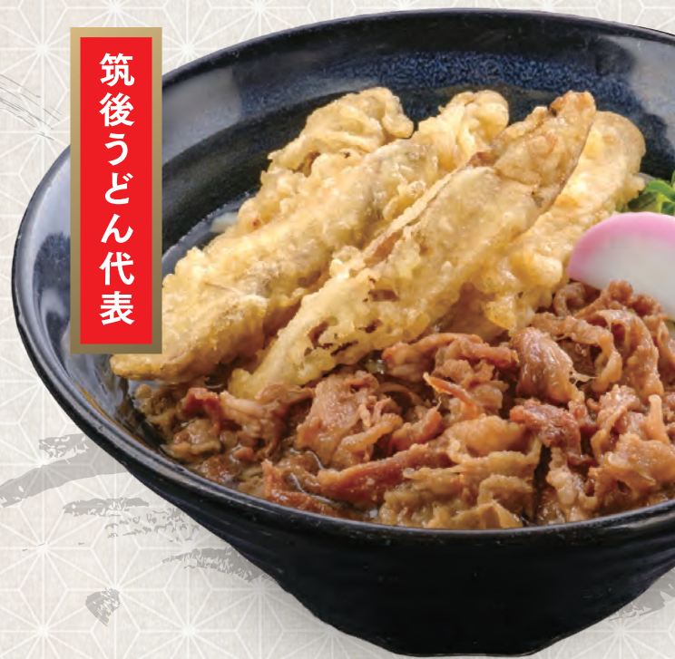
肉ごぼう天うどん 890円 税込