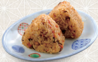
かしわおにぎり2個 280 税込 円