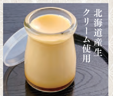
やっちゃんプリン 350 税込 円