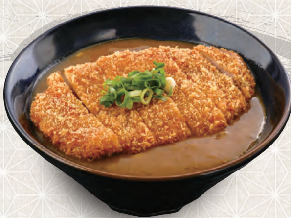
カツカレーうどん 1,080円 税込