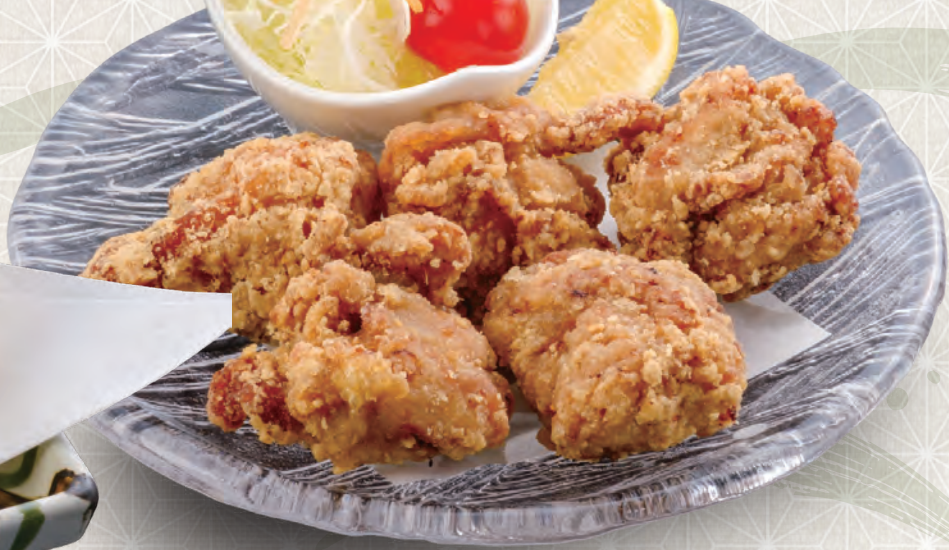
特製唐揚げ 大(10個) 並(5個) 小(2個) 1,180 税込 円 680 税込 円 280 税込 円