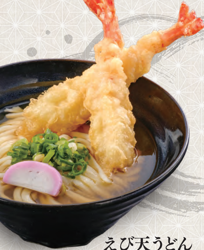
えび天うどん 790円 税込