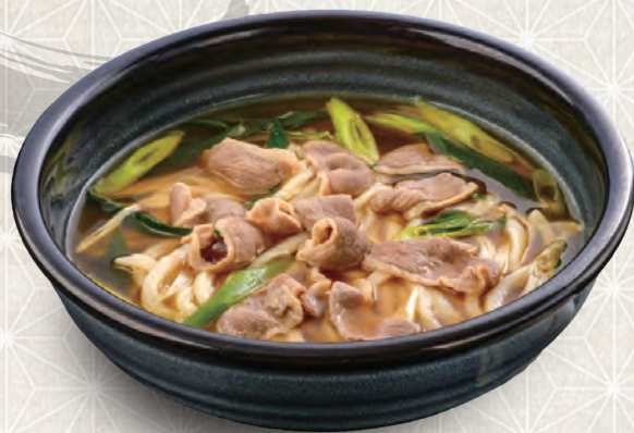
鴨南蛮うどん 830円 税込