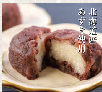
ぼたもち1個 180 税込 円