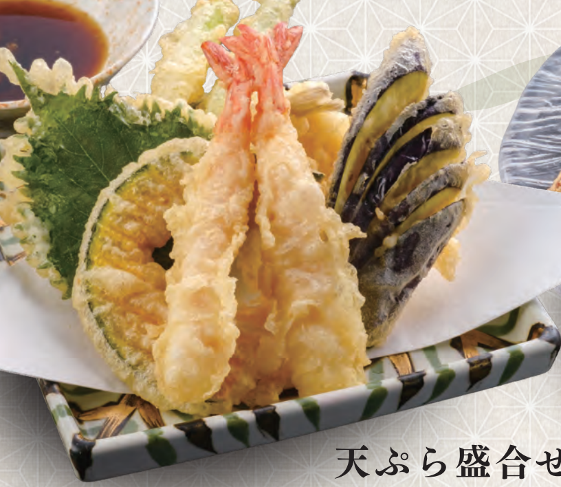
天ぷら盛合せ 880 税込 円