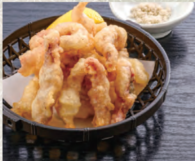
げそ天 420 税込 円