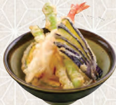
ミニ天丼セット 480円 税込