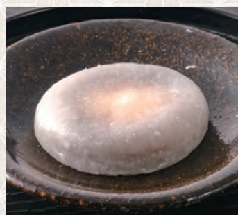
チーズクリーム大福 150 税込 円