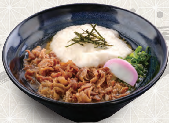
肉山かけうどん 990円 税込