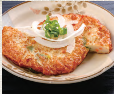
野菜のさつま揚げ 230 税込 円