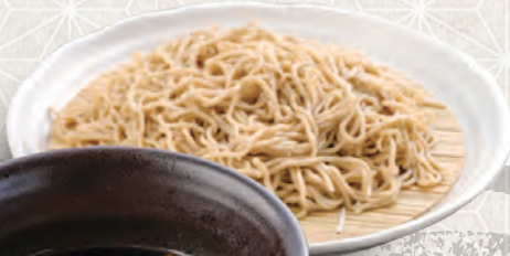
鴨せいりそば 1,040円 税込