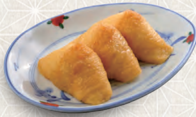
いなり3個 280 税込 円