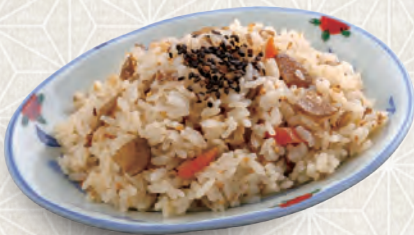
まぜめし 280 税込 円