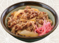
生卵 +90円 牛めしセット 480円 税込