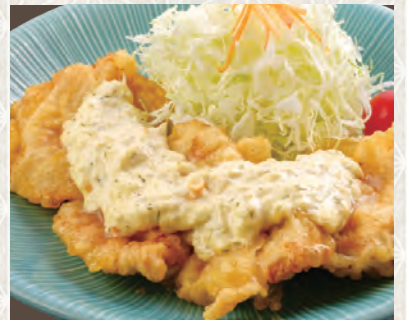
とり天南蛮 630 税込 円