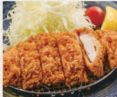
ロースカツ 980 税込 円