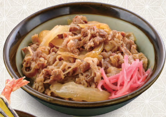
牛めし 530 税込 円 生卵 + 90円